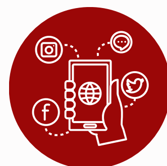
Kampania Social Media