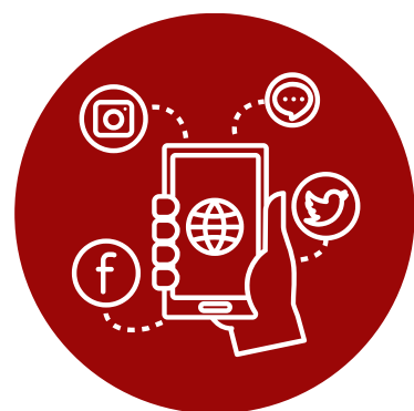
Kampania Social Media